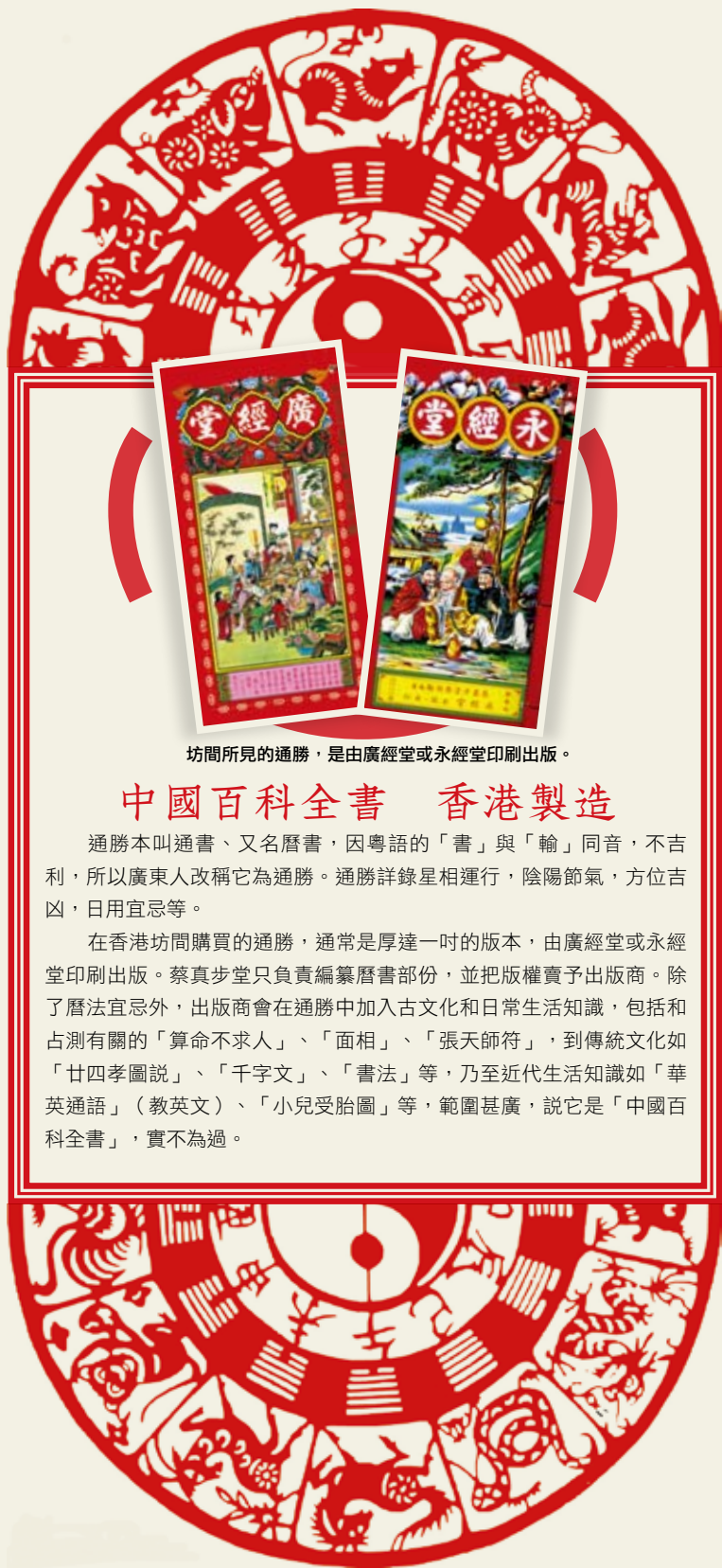
坊間所見的通勝，是由廣經堂或永經堂印刷出版。